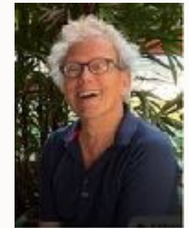
Joachim Baar, Pianist, Liedbegleiter 1. Preisträger des „Festivals Internazionale di Musica Vocale“ in Carpi, Italien, Konzerterfahrung in europäischen Ländern, Südamerika und Singapur